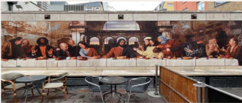
The last supper, Dublin