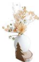
KUGELVASE AUF HOLZ 3 EURO