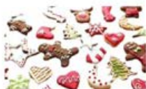
PLÄTZCHEN 2 EURO