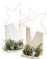
LEUCHTSTERN 12 EURO