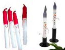
DIP-DYE-KERZEN 0,50-1,50 EURO