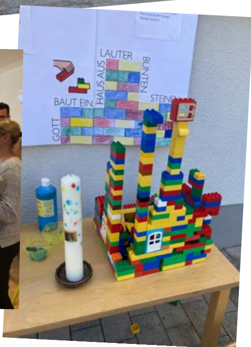
Einweihung KITA St. Pius